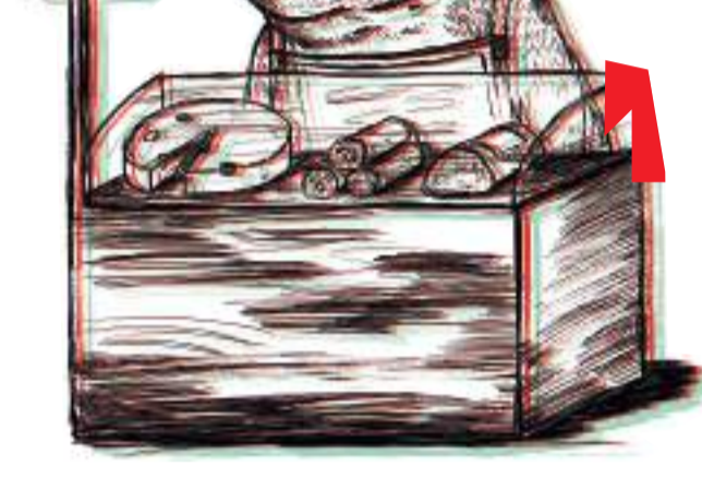
Tabla de 2 quesos a elegir: 9,90 €

Finocchiona (salame toscano curado con hinojo).